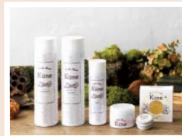
つながりから生まれたコスメ